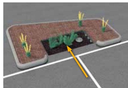
Flöde från långsida